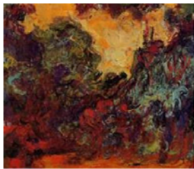
La maison vue du jardin aux roses (1923-1924)