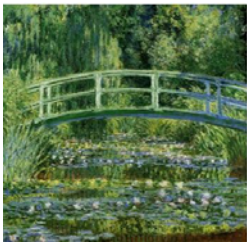
Le bassin aux nymphéas, Pont japonais à Giverny